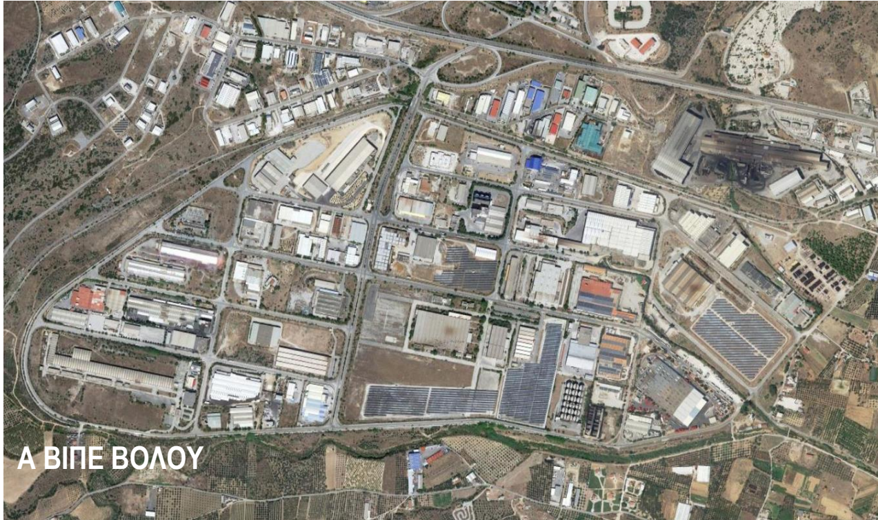
A ΒΙΠΕ ΒΟΛΟΥ