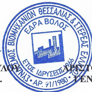
ΑΡΙΣΤΟΜΕΝΗΣ ΕΦΡΑΙΜΙΔΗΣ ΓΕΝΙΚΟΣ ΓΡΑΜΜΑΤΕΑΣ